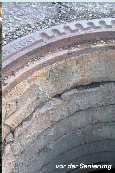
vor der Sanierung