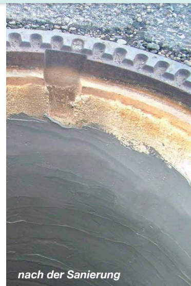
nach der Sanierung